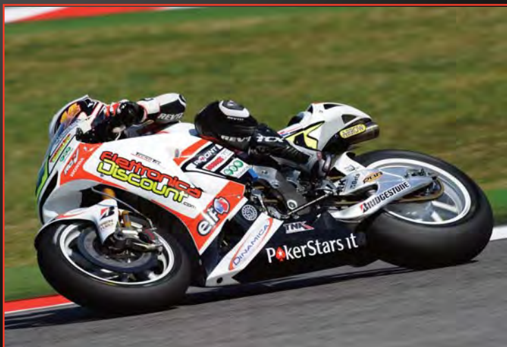
Italy - Misano 05/09/2010