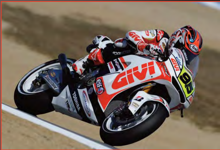
United States - Laguna Seca 24/07/2010